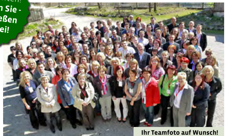
Ihr Teamfoto auf Wunsch!

Viele Möglichkeiten! Nächtigen Sie - und genießen stressfrei!