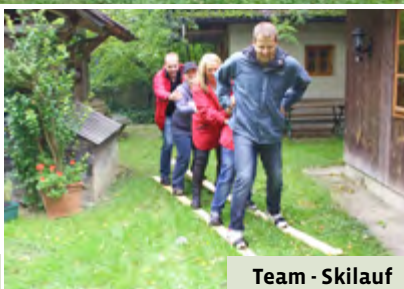
Team - Skilauf